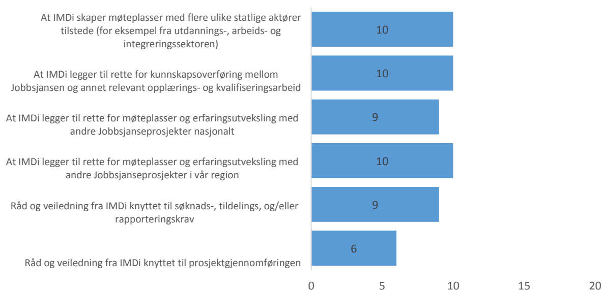
Figur 3.2: Råd og veiledning fra IMDi. Ville det være nyttig for ditt prosjekt å framover få støtte til Antall. (N=20)

Figuren over viser at prosjektene ønsker oppfølging fra IMDi framover, og den viser at prosjektene ønsker seg en rekke ulike typer oppfølging. Halvparten av respondentene ønsker at IMDi legger til rette for i) møteplasser og erfaringsutveksling med andre Jobbsjans-prosjekter i egen region og ii) med ulike statlige aktører tilstede. Nesten like mange ønsker at IMDi legger til rette for møteplasser og erfaringsutveksling med andre Jobbsjansprosjekter nasjonalt. Ti av 20 respondenter ønsker dessuten at IMDi legger til rette for kunnskapsoverføring mellom Jobbsjansen og annet relevant